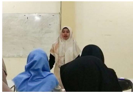
Gambar 2.2 Kegiatan Pembelajaran